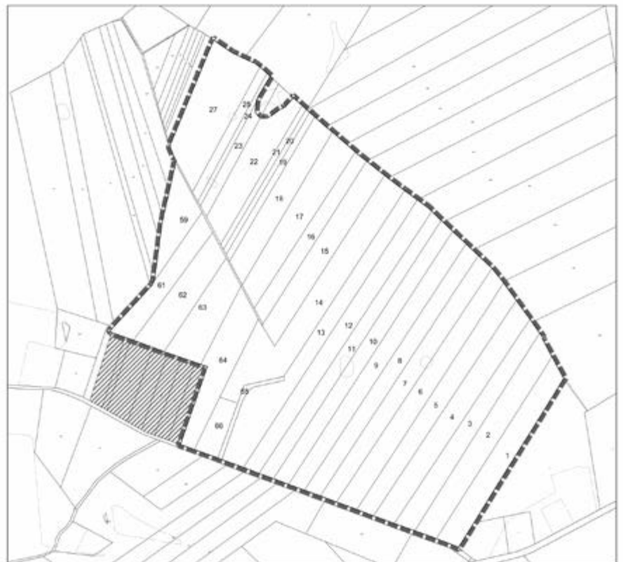
Bebauungsplan der Gemeinde Prötzel "Solarpark Harnekop" Ausgrenzung