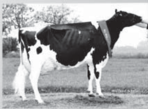
„Lamour“ – Miss Märkisch-Oderland 2013