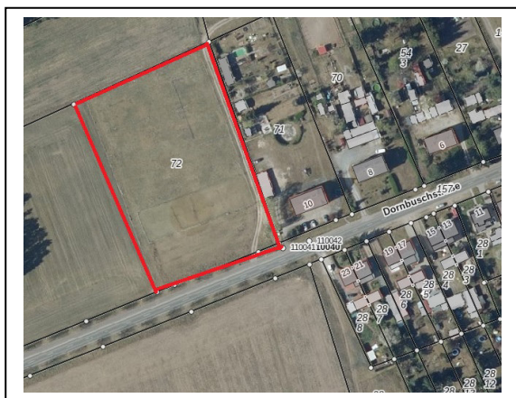
Abb. 2: Luftbild vom Änderungsbereich

Der Änderungsbereich ist unbebaut, eingezäunt (Pferdekoppel) und unbefestigt. Es handelt sich um eine Ackerfläche mit niedriger Ackerzahl 15, die temporär als Pferdekoppel genutzt wird. Die Fläche ist durch die unmittelbar angrenzende Bliesdorfer Straße mit den darin befindlichen Medien erschlossen. Der straßenbegleitende Geh-, Radweg an der Bliesdorfer Straße mit Anbindung an das Ortszentrum und die Stadt Wriezen stellt eine weitere positive Infrastruktur für den Änderungsbereich dar.