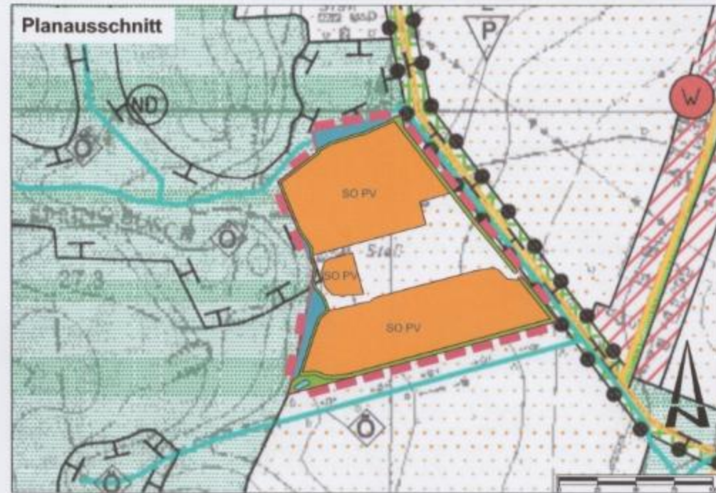
Als Grundlage für die Darstellung des Planausschnittes dient ein Ausschnitt des Flächennutzungsplanes (genehmigt am 21.06.2006, in Kraft getreten am 18.07.2006). Maßstab: 1 : 5.000